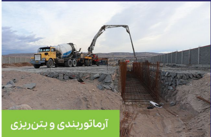
آرماتوربندی و بتن‌ریزی