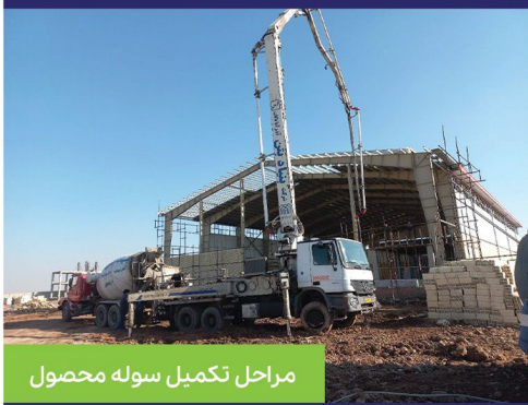
مراحل تکمیل سوله محصول