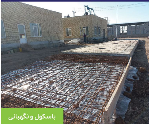
باسکول و نگهداری