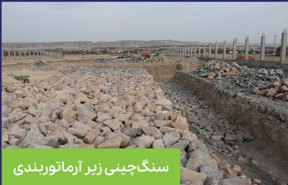
سنگ‌چینی زیر آرماتوربندی