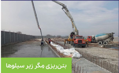
بتن‌ریزی مگر زیر سیلوه‌ها