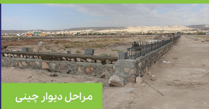
مراحل دیوار چینی