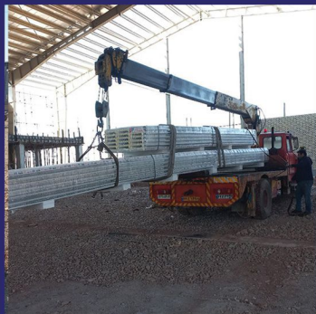
مراحل تکمیل سوله محصول