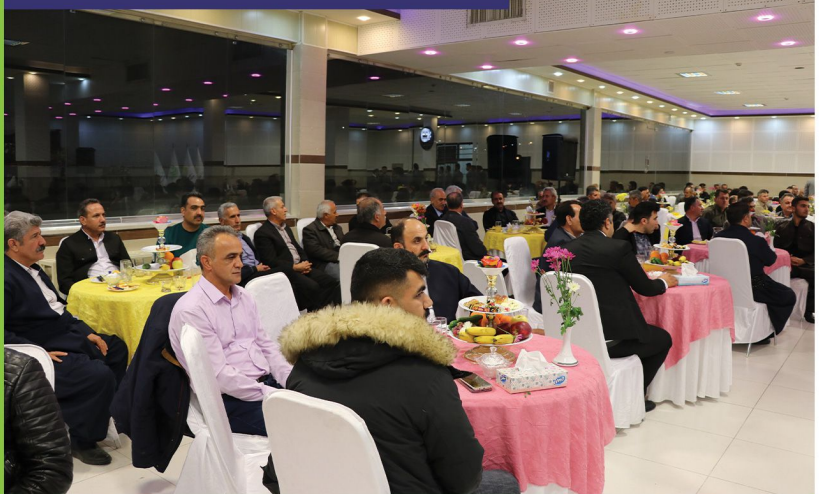
گردهمایی مرغداران غرب کشور در شهرستان مهاباد