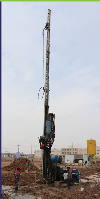
عملیات بهسازی خاک (DSM)