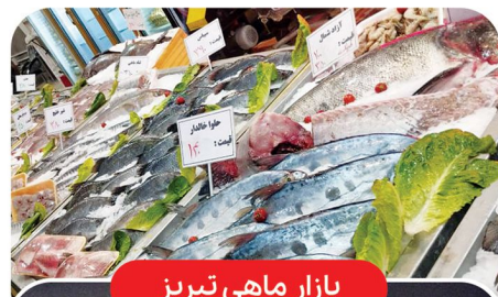
بازار ماهی تبریز