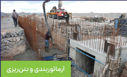
آرماتوربندی و بتن‌ریزی